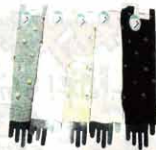
アームウォーマー 4色 5色 6色 7色 8色

だんだんあったかくなってきて、 過ごしやすくなってきましたね(*^-^*) 外で過ごすことも多くなってくる 時期ですが、なんと5月は1年の中で 最も紫外線が多い時期になるんです！ みなさん知ってましたか(;o;)!? 紫外線は美肌の大敵なので、 日焼け止めやアームウォーマーなどで お肌を守ってあげましょう☆ by 深瀬 〈ハンドメイドがカヨリ〉