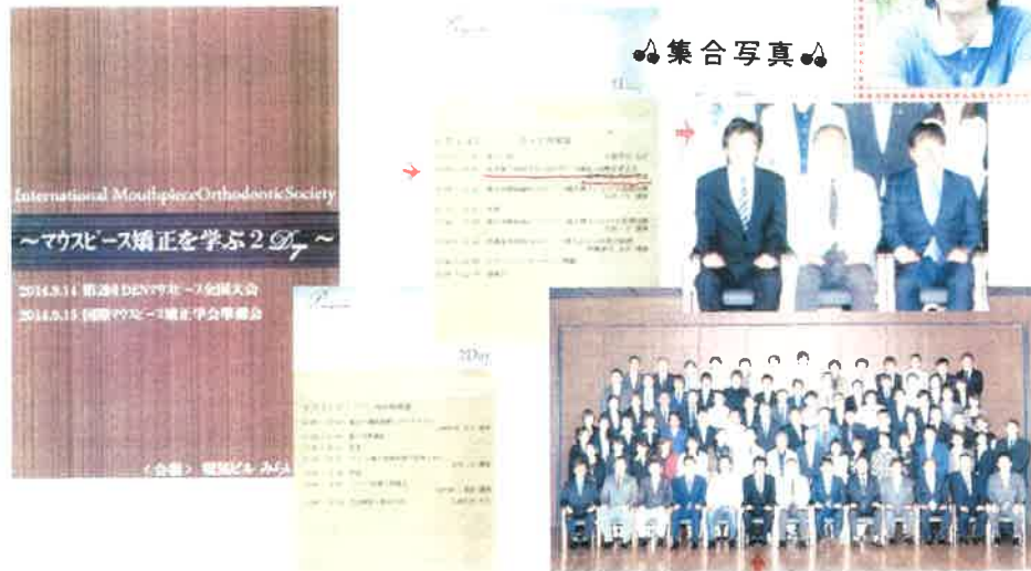
第2回 DEN マウスピース全国大会 2014.9.14-15 福岡県福岡市 みらいホール