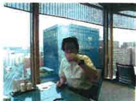
ホテルニューオータニ