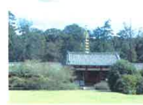
☆ 奈良の東大寺 ☆